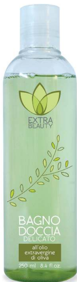
Linea Round FLACONE 250 ml

“Deterge delicatamente, lascia la pelle pulita e profumata”