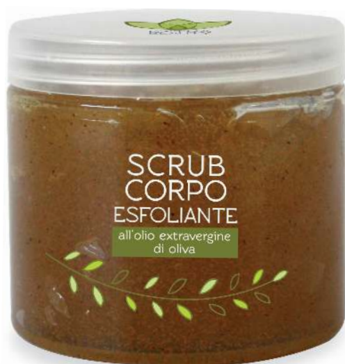
Linea Round - FLACONE 250 ml

“Scrub dall’azione esfoliante delicata e naturale”