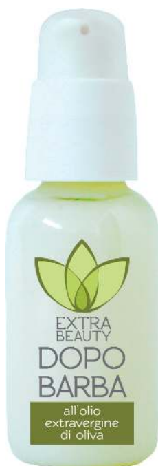
Linea Round - FLACONE 50 ml

“ Lenitivo dopo la rasatura, rende la pelle vellutata ”