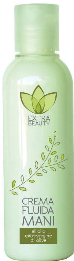
Linea Round FLACONE 125 ml

“ Trattamento cosmetico protettivo per le mani ”